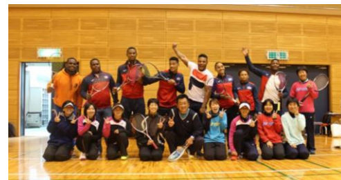
どん北とソフトテニス交流