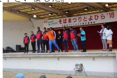
そばまつりのステージに立つ選手