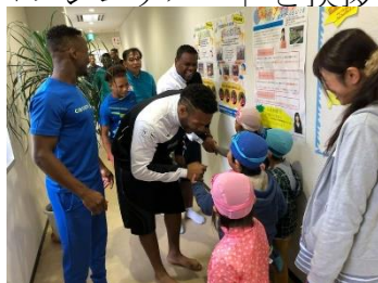
水泳教室に来た園児たちとの交流

11月中旬、ドミニカ共和国代表柔道選手が東京オリンピックホストタウンとなっている北広島町へ来日されました！トレーニング場所として温水プール SuiSui をはじめ千代田高校など町内の施設を利用されました。身長も高く、筋肉ムキムキ！その体の大きさに圧倒されました！選手の中には前回のリオ・オリンピックで7位に入賞した男子選手や子供を産んでママさんとなり現役復帰したドミニカのヤワラちゃんもいらっしゃり、すごい実績を持った選手達。トレーニングも黙々とこなし、少しコワモテ・・・と思いましたが、そこはやはりラテン系な国だけあってとても陽気！いつも笑顔で「コンニチハ～」と挨拶もして下さいました。