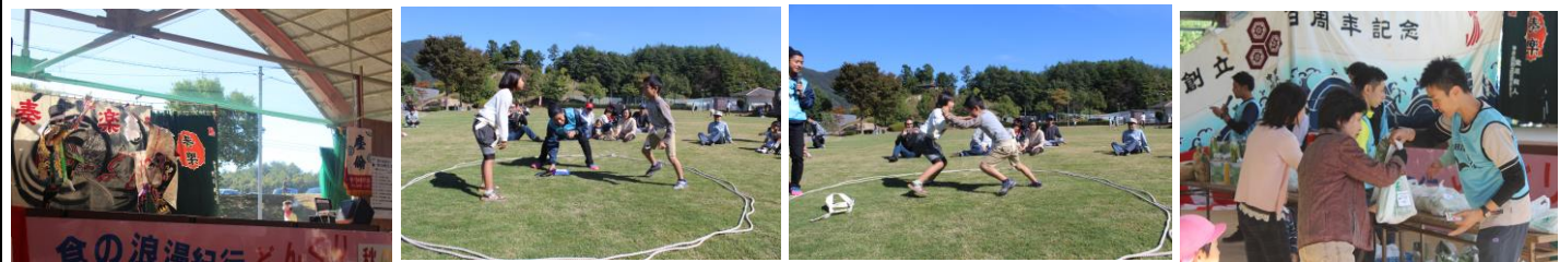
上石・今吉田の神楽団2幕ずつ4幕の舞に歓声が響きました。

～ひろみらプロジェクト～ ひろしま未来協創プロジェクト (文科省)「地(知)の拠点整備事業」 (豊平どんぐり村プロジェクト) このプロジェクトは広島修道大学、どんぐりクラブ屋台村、どんぐり財団が協力し、3者一体となり豊平地域をさらに元気にする事を目的にがんばっています。秋の陣では、学生さんのサポートのもと、子ども達が紙だけで作ったペーパードレスで「ちびっこファッションショー」を行い12月14日に完成式が行われる「どんぐりタワー発表セレモニー」が行われました。どんぐりタワーとは、どんぐり村にシンボルを作ろう！という趣旨で屋台村を中心にどんぐり集めを呼びかけ、なんと40,800個のどんぐりが集まりました！12月14日のイベントはクリスマスイルミネーションとして完成式を行います。たくさんの皆様にお越しいただきたいと思います！